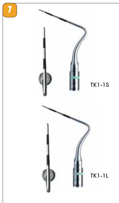
Рис. 4. Эффект микростриминга. Рис. 5. Насадка для удаления вкладок, анкерных штифтов из корневого канала. Рис. 6. Насадка для латеральной конденсации SO4. Рис. 7. Применение насадок TK1-1S, 1L при обследовании пациентов. Рис. 8. Пародонтологические насадки TK1-1S, 1L.

тратили драгоценные часы в процессе извлечения металлических конструкций, теперь же это занимает нескольких минут (рис. 4).