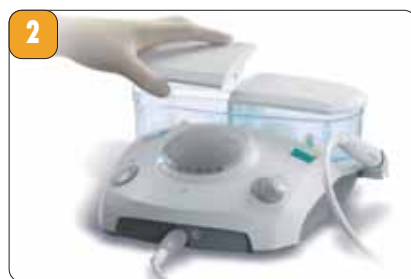
Рис. 2. Ультразвуковой аппарат P-MAX NEWTRON XS.