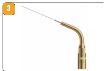
Рис. 3. Насадка IRR 25 для пассивной ультразвуковой обработки.