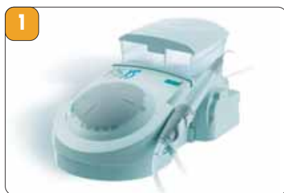
Рис. 1. Ультразвуковой аппарат P-5 NEWTRON XS.

Особо следует отметить насадки (ETPR) для удаления инородных тел из корневого канала (вкладки, металлические штифты). До появления этой разработки фирмы Satelec стоматологи